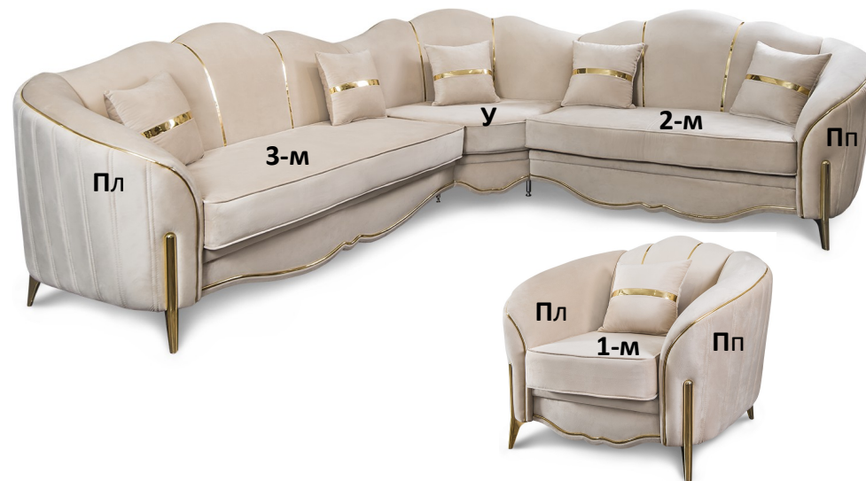
МОДУЛИ для КОМПЛЕКТАЦИЙ МЯГКОЙ МЕБЕЛИ «ЛАРА»